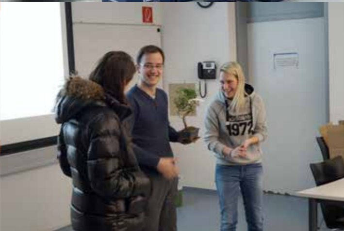
Ein großes Dankeschön an Ensinger, Alpirtsbacher und das Gartencenter Dehner für die Unterstützung in Sachen Verpflegung und Dekoration!